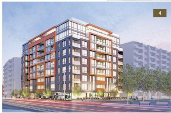
圖 4：早已賣了90%以上的 Onyx 大樓 (Benvenuto Group)